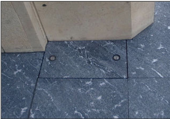
仕上げ後に目地が見えない タイプの化粧蓋