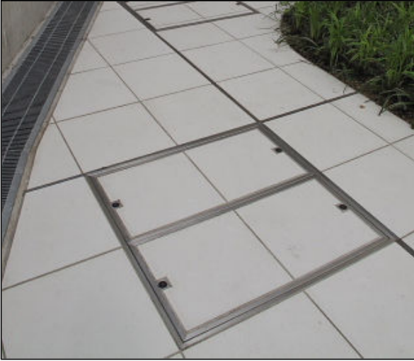
マシンハッチ 周辺タイル(口395)に合わせて 枠外寸法口795で製作