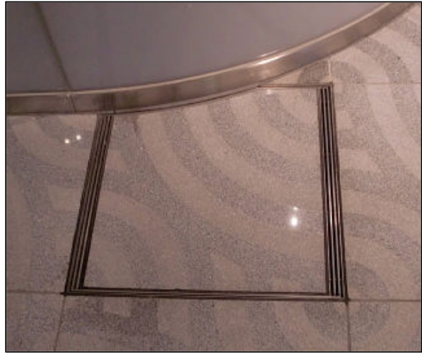
周辺構造物にあわせた 形状のスリット化粧蓋