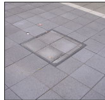
周辺タイルと目地が 合わない場合